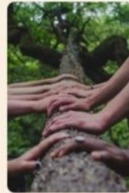
VIDA SANA Y ESPIRITUAL

sido parte de nosotras, por que respetarla es trabajo de todos se enlaza proyectos donde puede formar parte